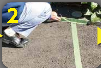
2 作業箇所以外を汚さない ように養生テープを貼ります