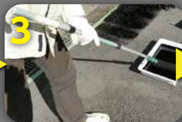
3 油性用のローラー刷毛で 塗装して下さい