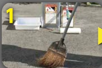
1 塗装面の汚れ・ゴミ・水分等を 取り除いて下さい