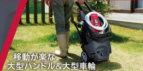
移動が楽な 大型ハンドル&大型車輪