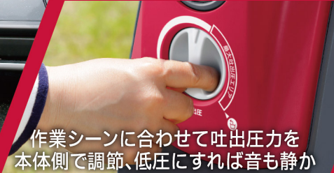
作業シーンに合わせて吐出圧力を 本体側で調節、低圧にすれば音も静か