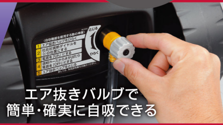
エア抜きバルブで 簡単・確実に自吸できる