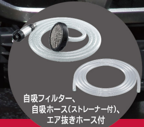
自吸フィルター、 自吸ホース(ストレーナー付)、 エア抜きホース付