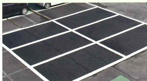
この通り！ ※ラインにはW-100、駐車面は水性パーキングブラックを施工しています。