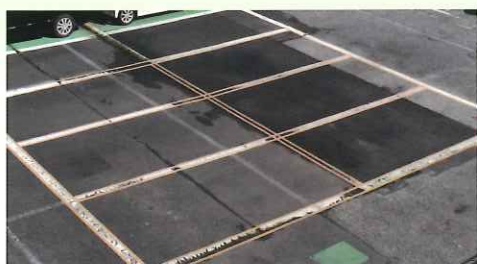
かすれたラインが…