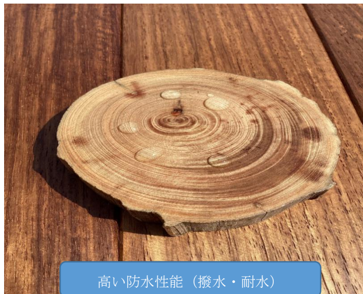
高い防水性能（撥水・耐水）