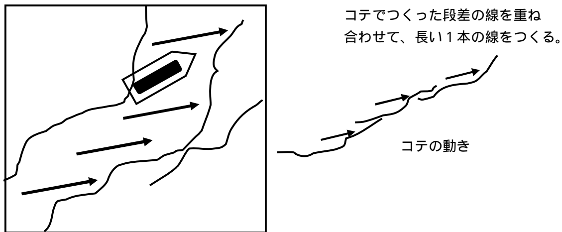
図 - 1