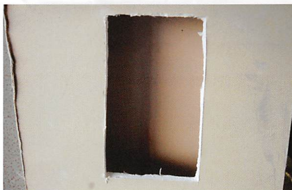
スイッチボックス穴あけ間違い