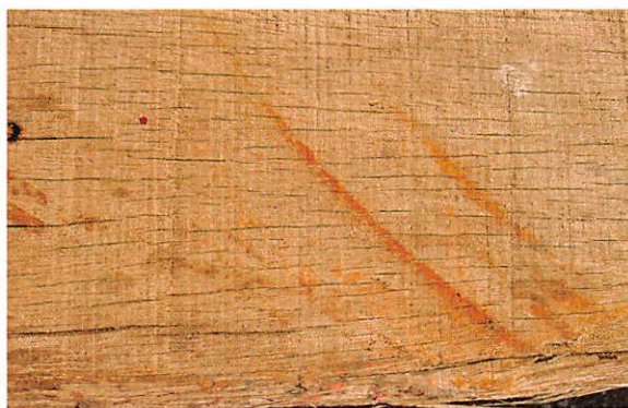
木割れ下塗り兼用(破風等)