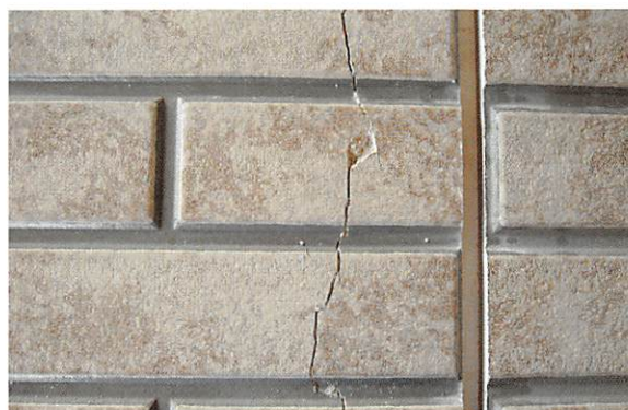
サイディングボード割れ補修