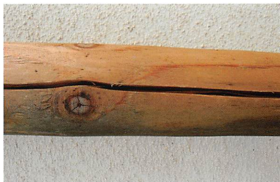
丸太の割れ補修(ログハウス等)

※使用方法などは営業担当者におたずねください。 書き落とし面の補修等まだまだ使用箇所・使用方法は広がっています。