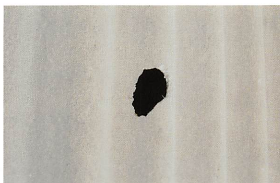
波スレート穴補修