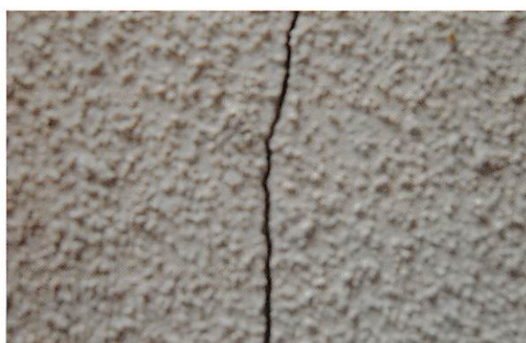
モルタル面クラック補修