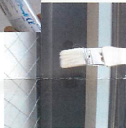
付属の刷毛などを使い クリアツールαを塗布します