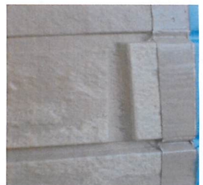
きれいな仕上がり♪

クリアツールαは硬化したプライマーやプロテクターをも除去できる画期的な商品ですがプライマー等を誤って付着させてしまった際には硬化する前に発見し除去することをお奨めします。