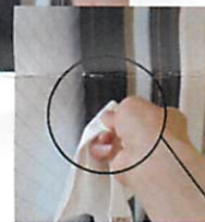
付属のクロスで拭き取ります