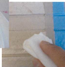
あらかじめ水で湿らせたクロスにクリアツールαを少量染み込ませ（希釈して）拭き取ります