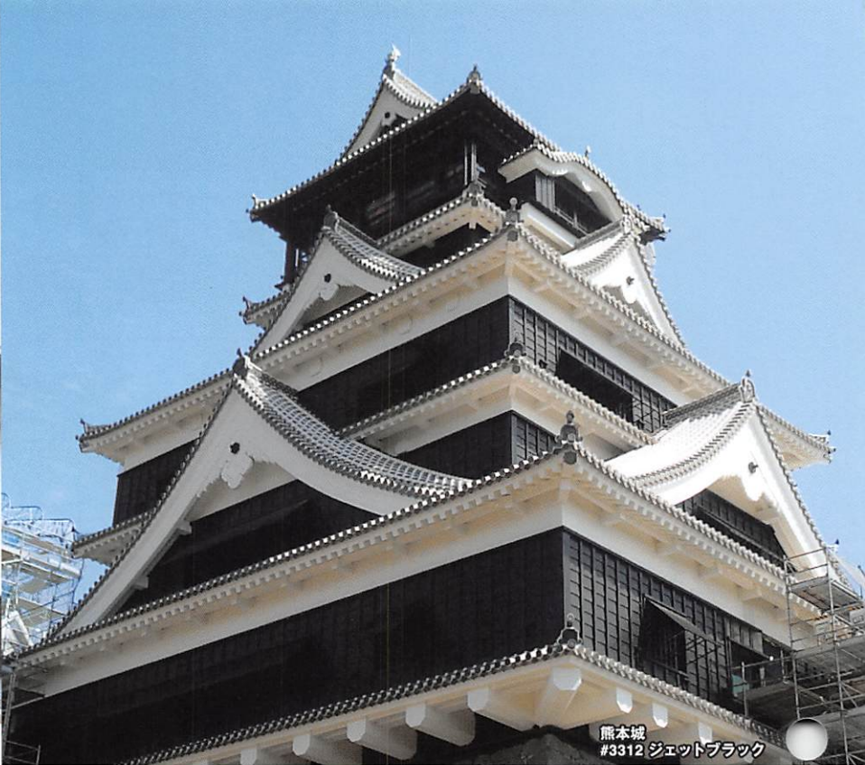
熊本城 #3312 ジェットブラック