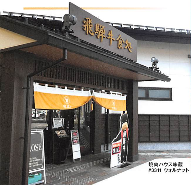
焼肉ハウス味蔵 #3311 ウォルナット