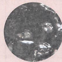
エスケー強化シーラー