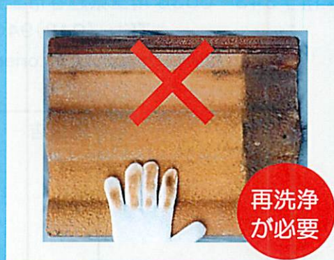
色粉が多く付着する

※このカタログの内容については、予告なく変更することがありますのであらかじめご了承ください。