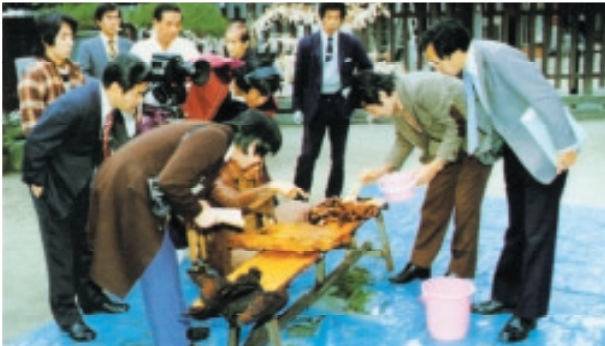
昭和56年11月 櫛田神社施工現場