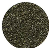
K-666 / 中目