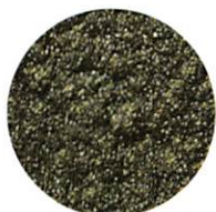
K-888 / 荒目